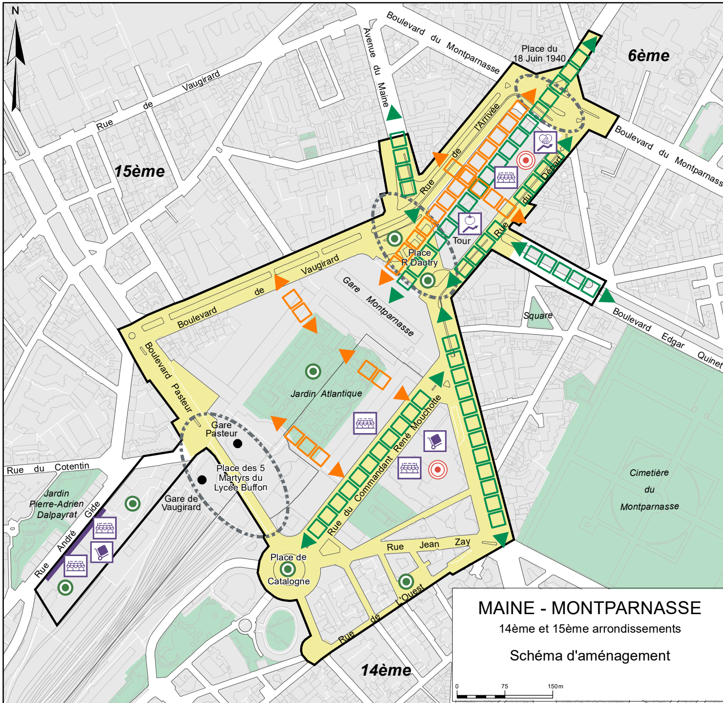
MAINE - MONTPARNASSE 14ème et 15ème arrondissements Schéma d'aménagement